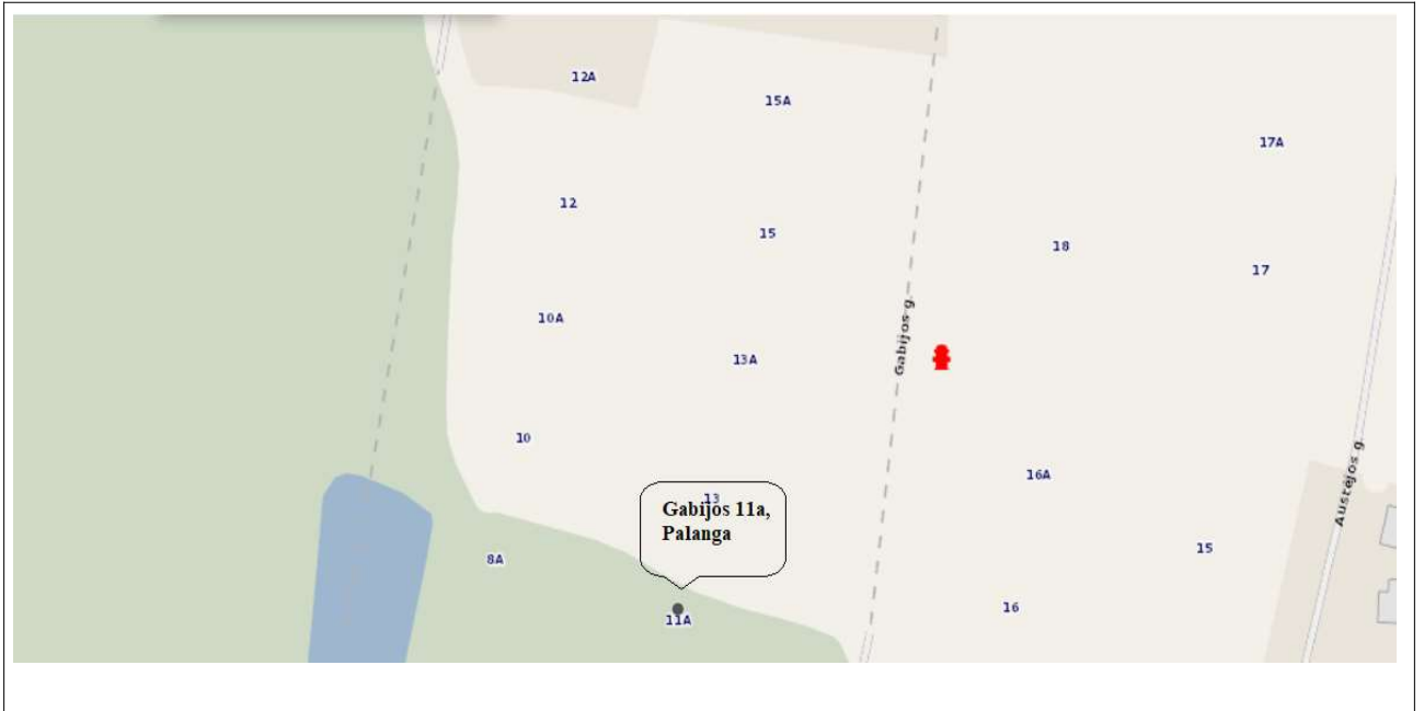
Ištrauka iš Hidrantų žemėlapis

3.6 Atstumai iki pastatų. Vadovaujantis “Gaisrinės saugos pagrindiniais reikalavimais, planuojami statiniai atitinks 6 lentelėje nustatytus minimalius priešgaisrinius atstumus tarp pastatų.