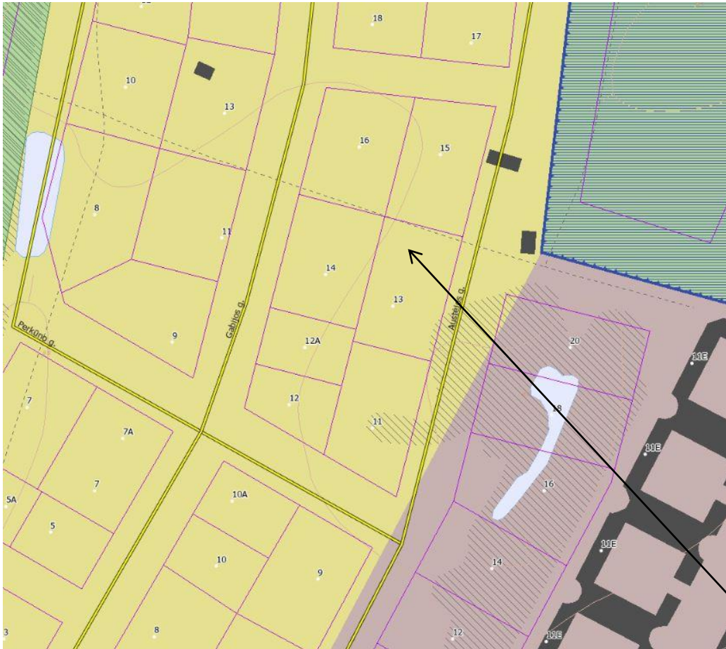
PALANGOS MIESTO SAVIVALDYBĖS TERITORIJOS BENDROJO PLANO PAGRINDINIO BRĖŽINIO REGLAMENTŲ LENTELĖ