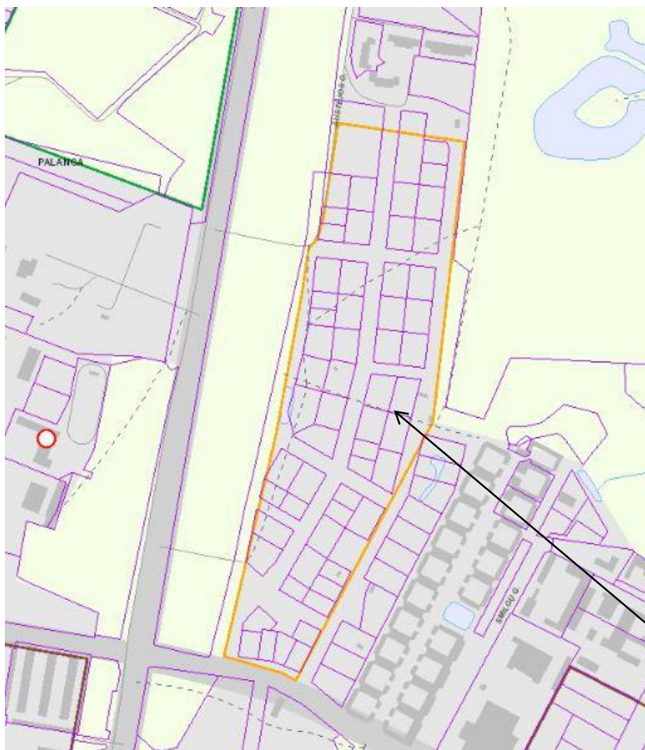
Planuojamos teritorijos vieta