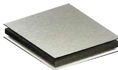
Aliuminio kompozito plokštė. Spalva RAL 7040