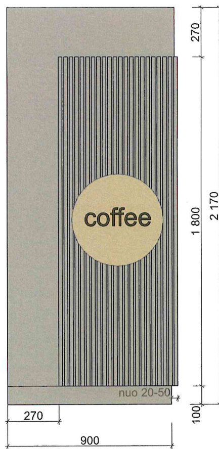
VAIZDAS IŠ ŠONO