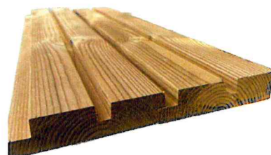
Dažyta termomediena. Spalva RAL 7040