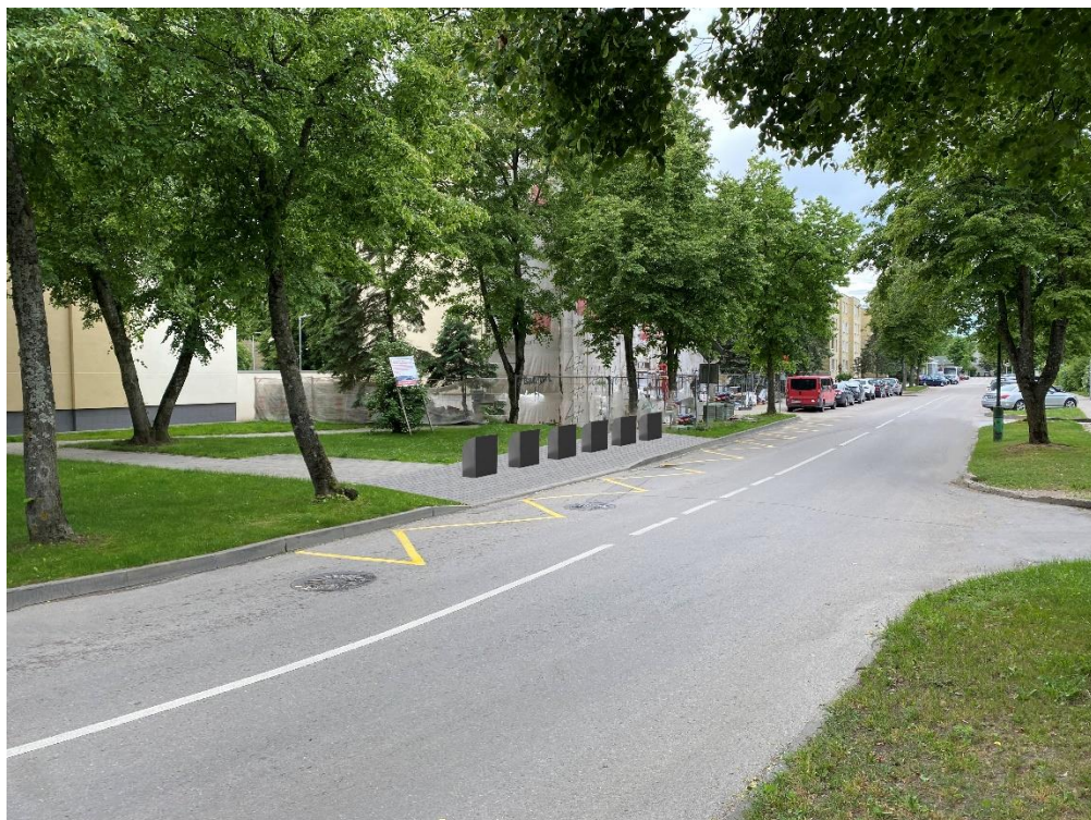
5 pav. Druskininkų g. 14