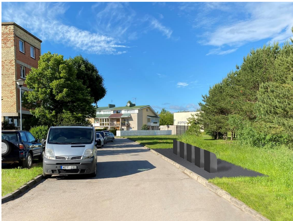
11 pav. Laukų g. 4