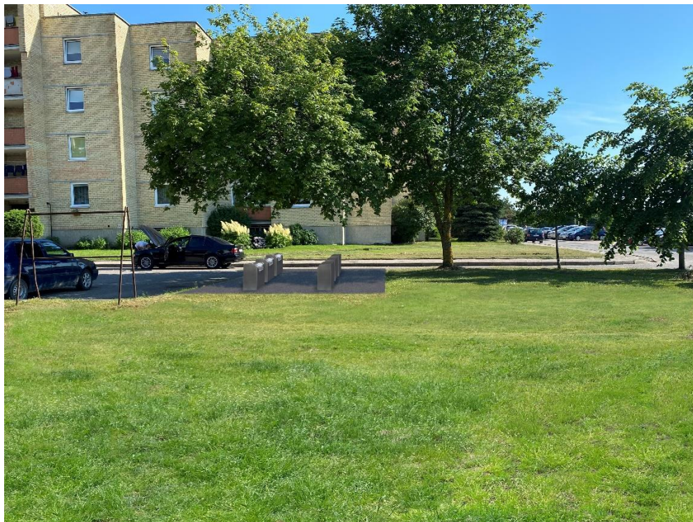
3 pav. Bangų g. 30