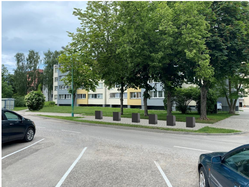
4 pav. Druskininkų g. 3