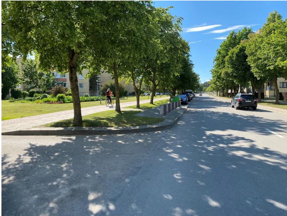
12 pav. Medvalakio g. 21