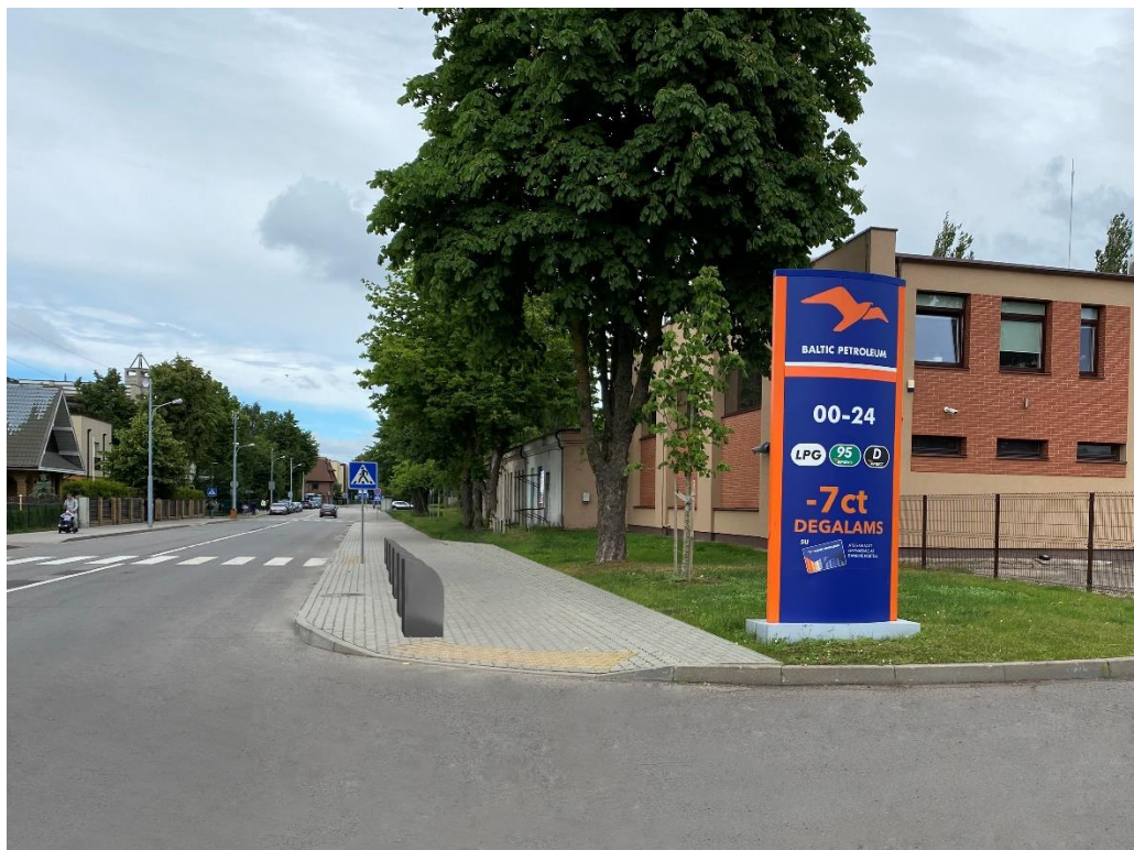
7 pav. Ganyklų g. 30