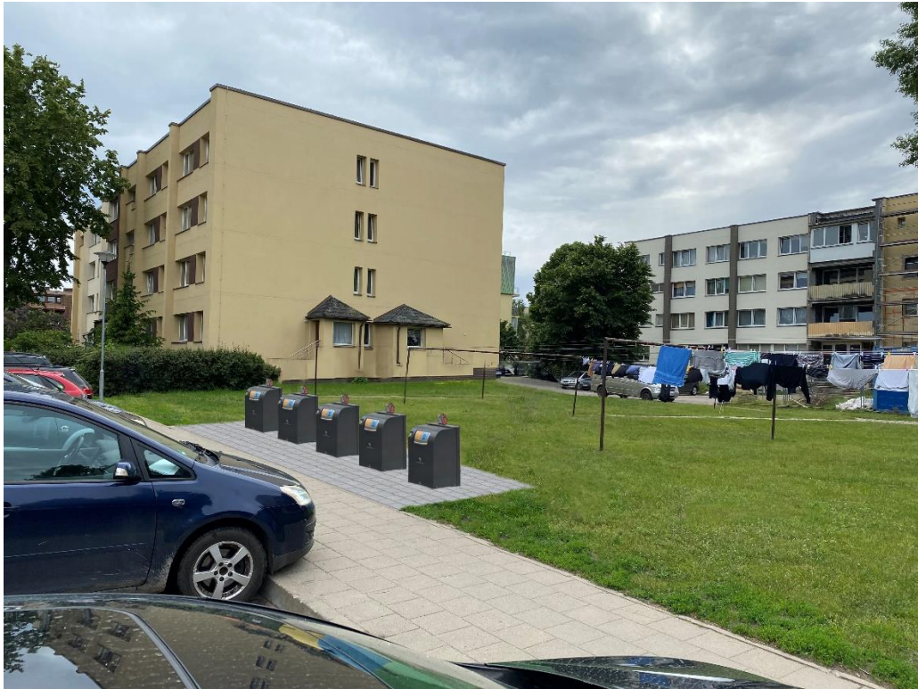
6 pav. Druskininkų g. 20