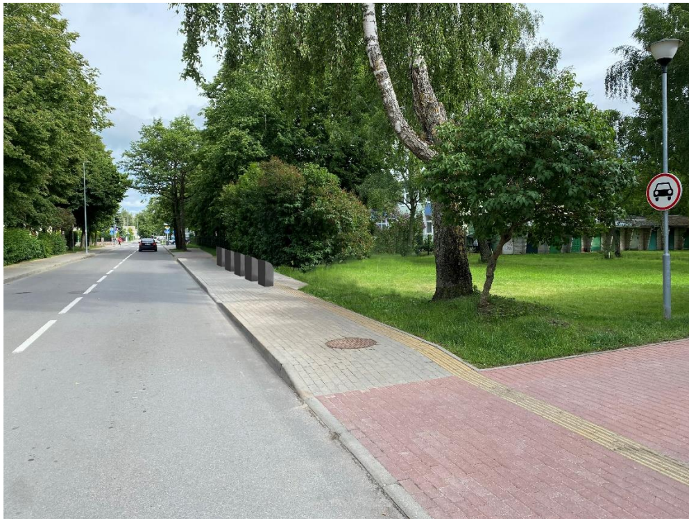
10 pav. Kastyčio g. 34