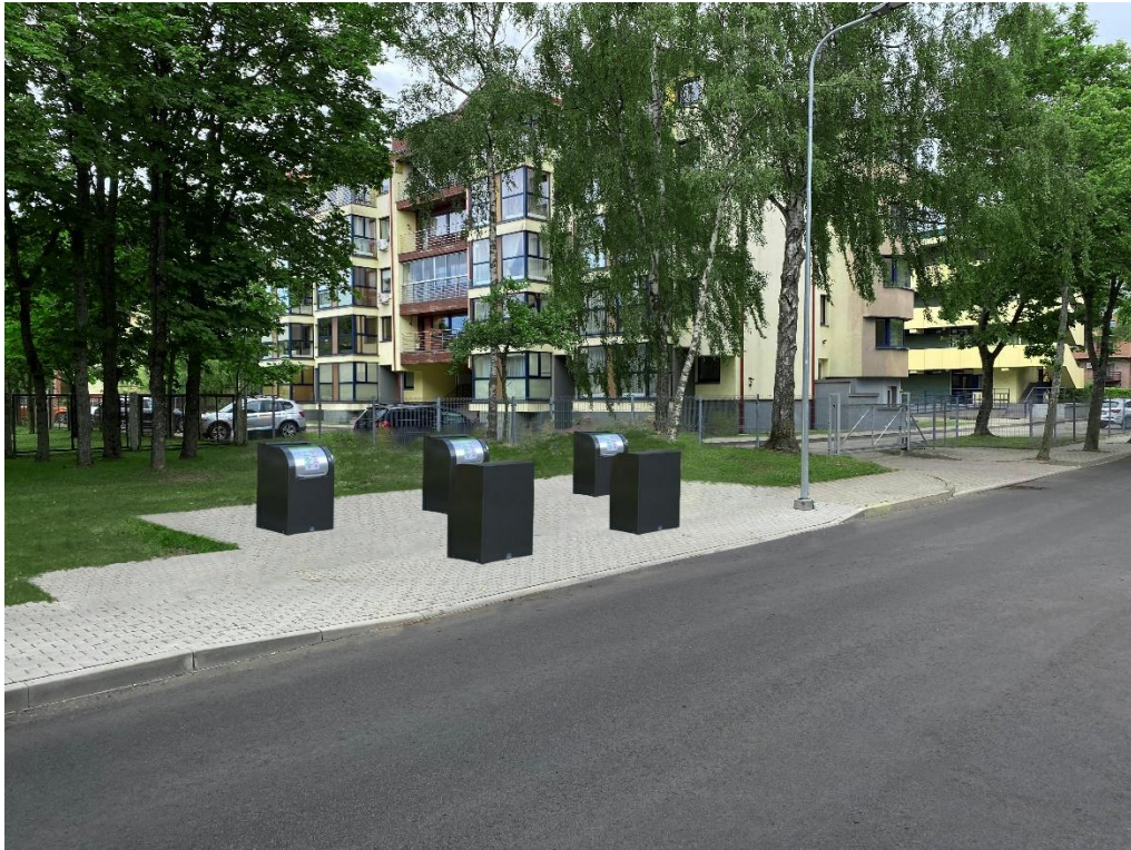
2 pav. Bangų g. 3