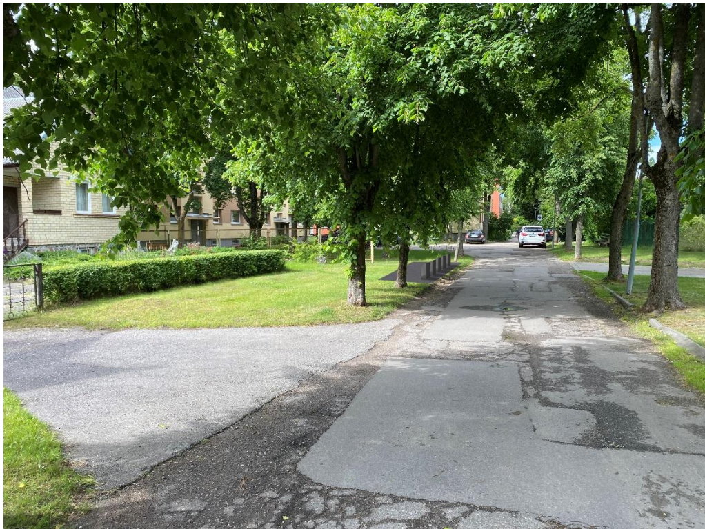
9 pav. Ganyklų g. 29