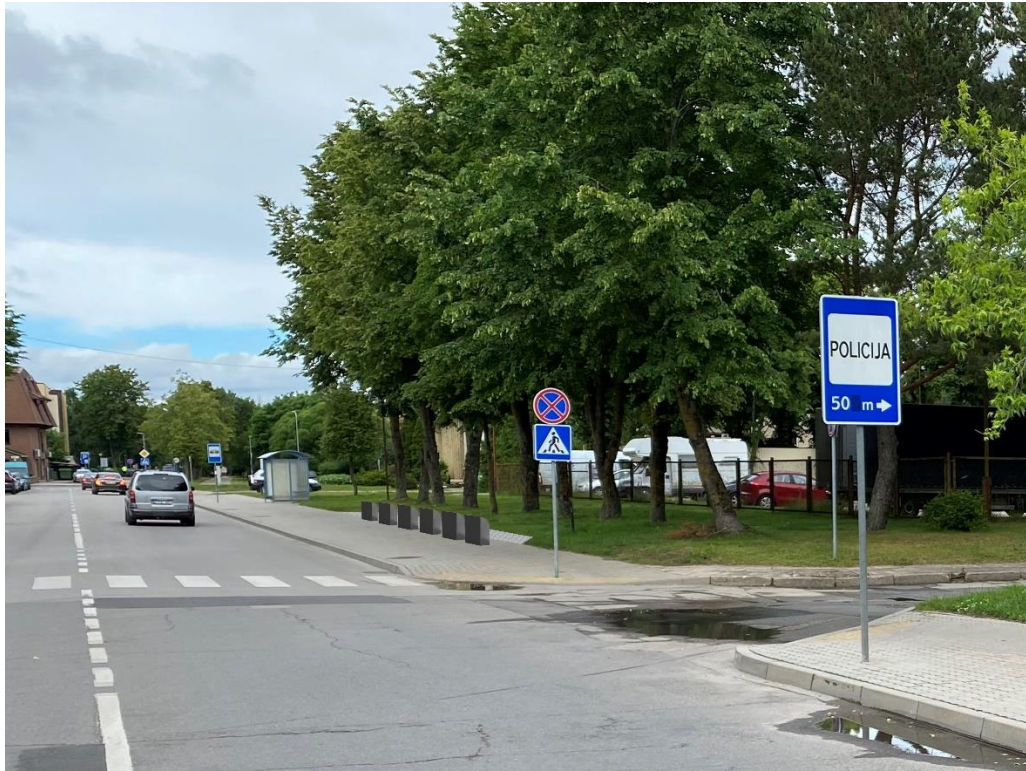
8 pav. Ganyklų g. 69