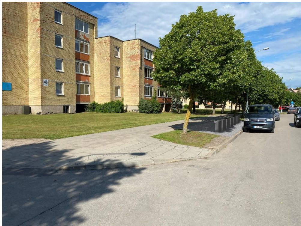
13 pav. Sodų g. 46