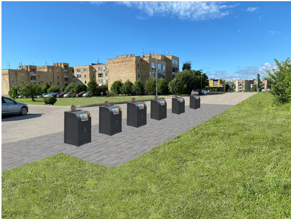
14 pav. Vasaros g. 5