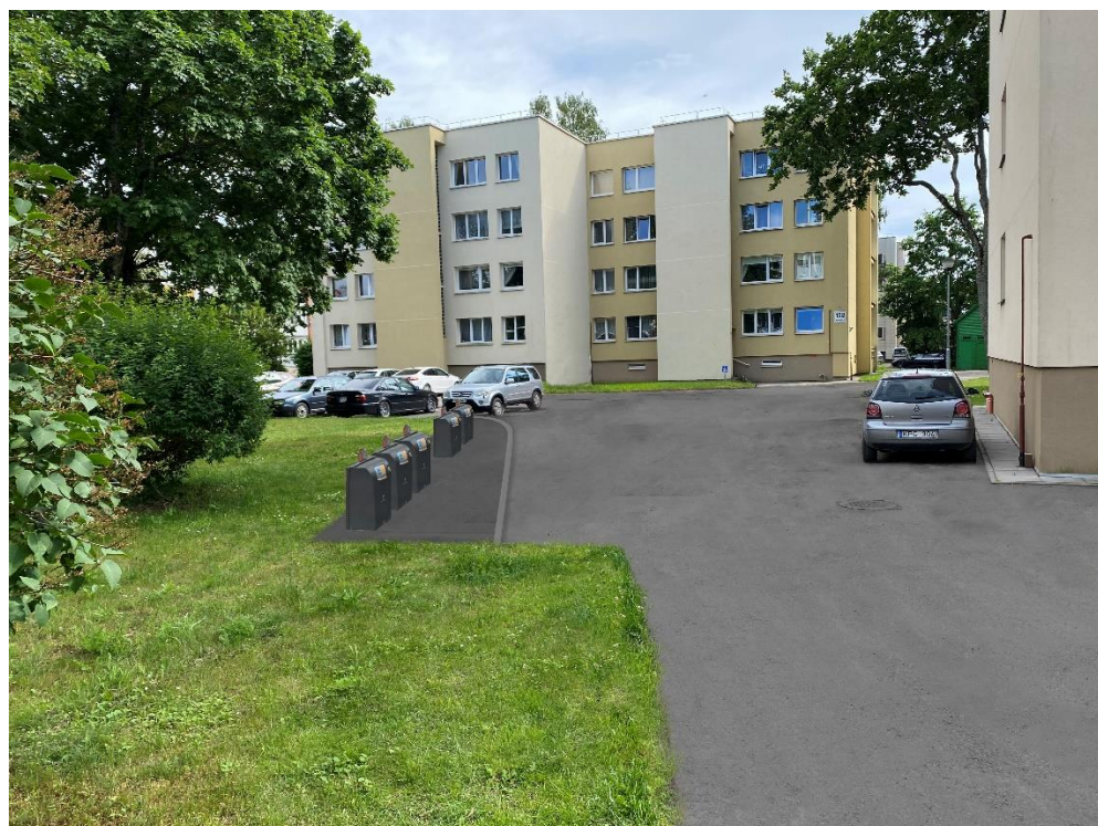
15 pav. Vytauto g. 138