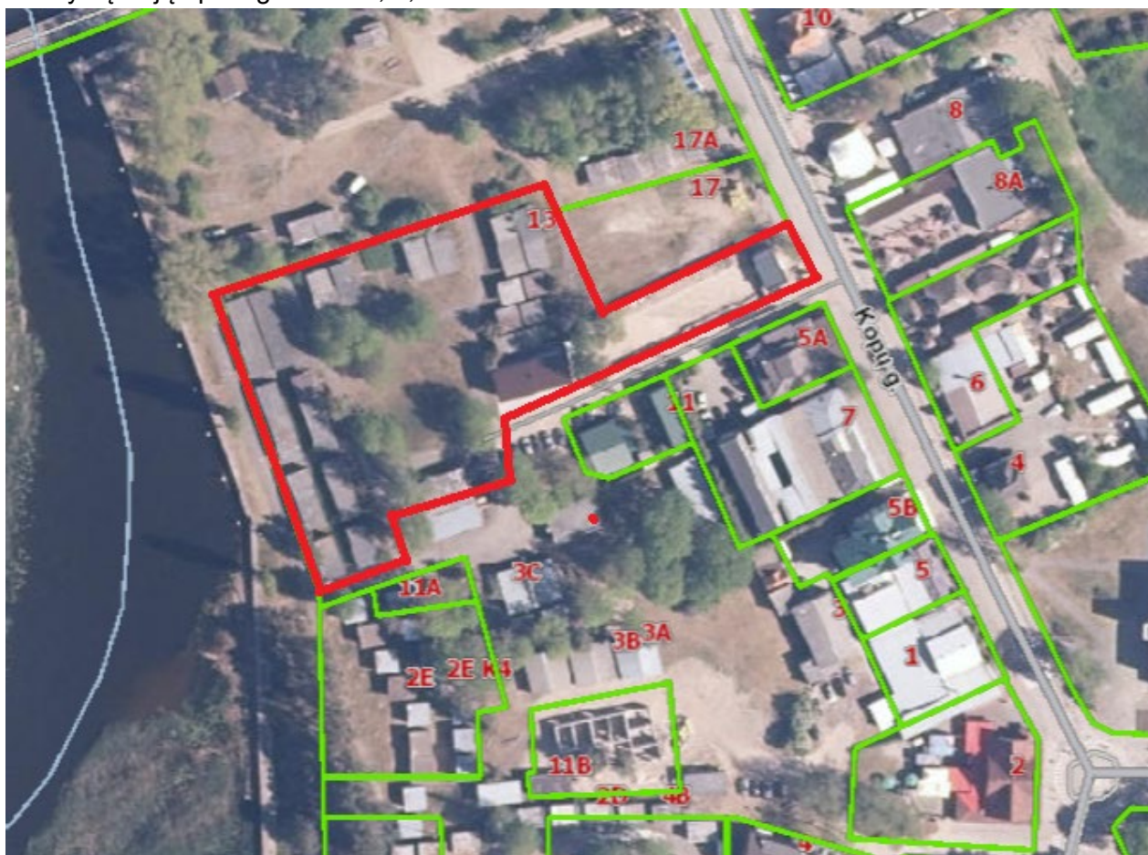
Situacijos schema, planuojamas sklypas - Kopų g. 13, Palanga