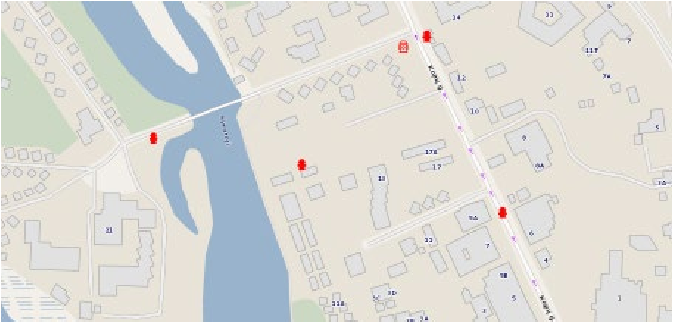
Ištrauka iš www.palangosvandenys.lt hidrantų išdėstymo žemėlapis

Konkretūs sprendiniai bus atliekami rengiant techninį projektą, gavus technines sąlygas. Gaisrų gesinimo įranga turi tenkinti Priešgaisrinės apsaugos ir gelbėjimo departamento prie Vidaus reikalų ministerijos direktoriaus 2010-12-07 įsakymas Nr. 1-338 „Dėl gaisrinės saugos pagrindinių reikalavimų patvirtinimo“ (aktuali redakcija 2014-01-06 TAR, dok. Nr. 45), 2013-12-31 įsakymas Nr. D1-995/1-312 „Dėl gaisrinės saugos normų teritorijų planavimo dokumentams rengti patvirtinimo“ reikalavimus.