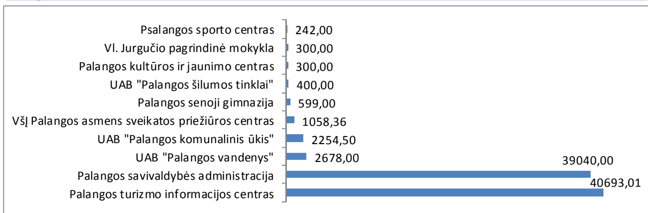
1 pav. Viešinimui 2018 metais skirtos lėšos, eurais

Šaltinis – Palangos miesto savivaldybės kontrolės ir audito tarnyba.