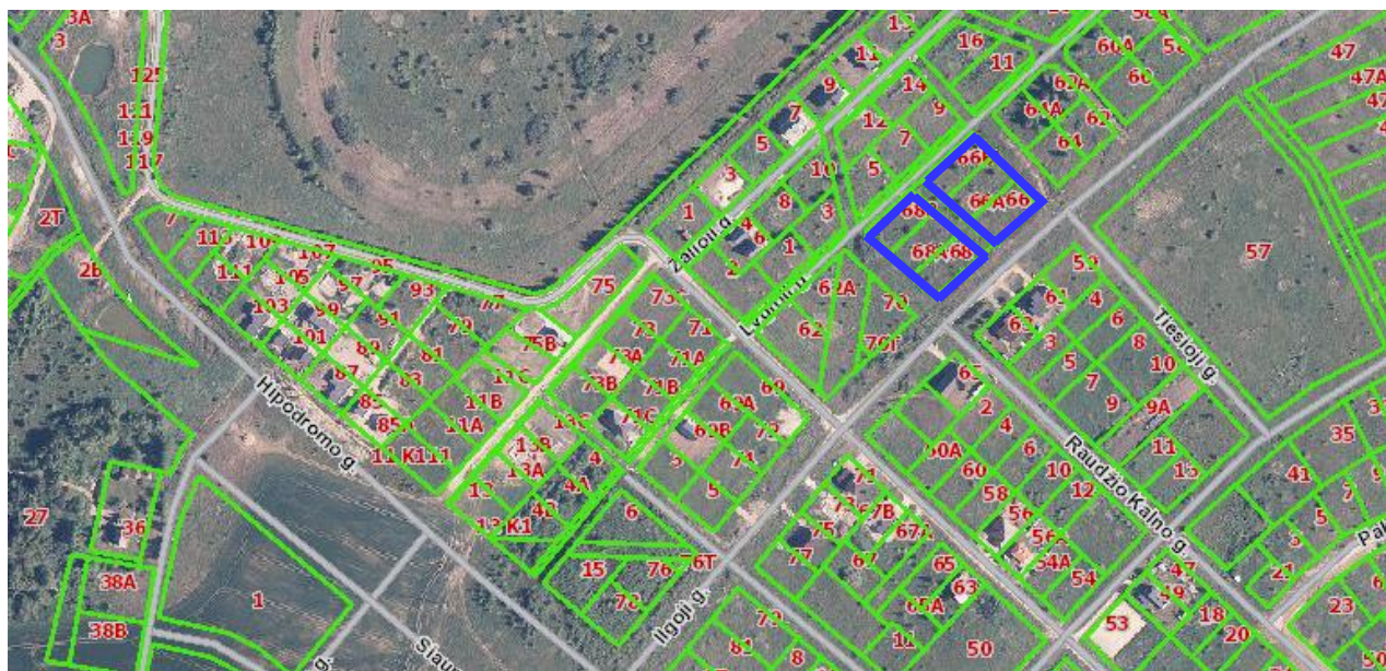
Situacijos schema: planuojami sklypai – Ilgoji g. 66, 66A, 66B, 68, 68A, 68B.

Detaliojo plano koregavimas apima 6 sklypus: Ilgoji g. 66, Ilgoji g. 66A, Ilgoji g. 66B, Ilgoji g. 68, Ilgoji g. 68A, Ilgoji g. 68B.