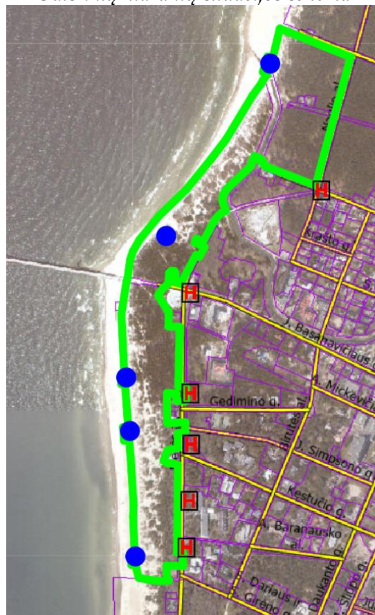
Gaisrinių hidrantų situacijos schema

Gaisrinė sauga: gaisrinė sauga bus užtikrinta remiantis priešgaisrinės gelbėjimo tarnybos gelbėjimo komandų pajėgomis. Galimų išorės gaisrų gesinimui numatomas vanduo bus imamas iš artimiausių gaisrinių hidrantų esančių Meilės alėjoje, Naglio alėjoje, Jūratės ir J. Basanavičiaus gatvėse, kurie nutolę nuo pastatų ne toliau kaip 150 – 200 metrų iki tolimiausio pastato kampo (žr. pridedama schema ). Patekimas prie laikinų statinių gaisriniais automobiliais, konteinerinio tipo, kilnojamųjų sanitarinių-higieninių mazgų įrengimo vietų galimas iš S. Dariaus ir S. Girėno gatvės per projektuojamo sklypo Nr. 12 servitutinį kelia S3-9 bei iš Žvejų gatvės (prie Žvejų g. 2A, Palanga). Šalia laikinų statinių, konteinerinio tipo, kilnojamųjų sanitarinių-higieninių mazgų įrengimo vietų, arčiau kaip 15 metrų atstumu pastatų nėra – priešgaisriniai atstumai išlaikomi.