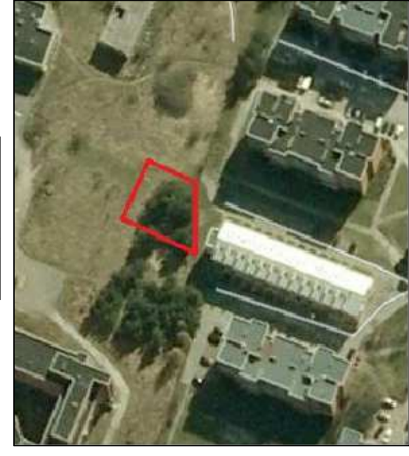
Ištrauka iš mapš.11