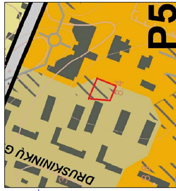
Ištrauka iš Palangos miesto Bendrojo plano