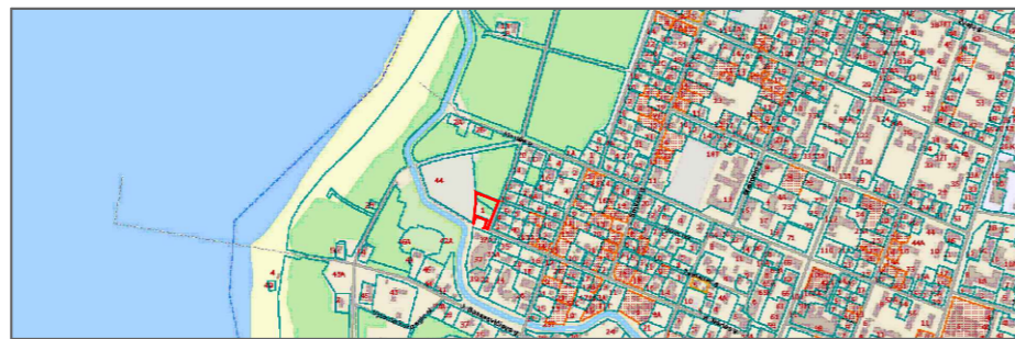
PLANUOJAMA TERITORIJA PALANGOS MIESTO KONTEKSTE