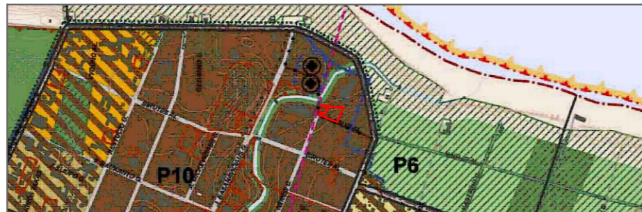
ISTRUKA IŠ PALANGOS MIESTO BENDROJO PLANO PAGRINDINIO BRĖŽINIO SPRENDINIŲ

PLANAVIMO UŽDAVINIAI - detalizuojant Palangos miesto bendrajame plane nustatytas teritorijos naudojimo reikalavimus, nustatyti teritorijų naudojimo reikalavimus, suplanuoti optimalų planuojamos teritorijos inžinerinių komunikacijų koridorių tinklą, nurodyti specialiąsias žemės naudojimo sąlygas, suformuoti optimalią urbanistinę struktūrą, numatyti priemones gamtos ir nekilnojamojo kultūros paveldo išsaugoti ir naudoti. PLANAVIMO TIKSLAS - optimalios urbanistinės struktūros numatymas, numatant inžinerinių komunikacijų tinklus, inžinerinei infrastruktūrai reikalingų teritorijų ir (ar) inžinerinių komunikacijų koridorių ribas, žemės sklypų sujungimas, suformavimas, naudojimo būdo ir naudojimo reglamentų nustatymas, Palangos miesto centrinės dalies detaliojo plano, patvirtinto Palangos miesto savivaldybės tarybos 2000 m. gegužės 25 d. sprendimo Nr. 32 1 punktu, ir žemės sklypo S. Nėries g. 37, 37A, Palangoje, detaliojo plano, patvirtinto Palangos miesto savivaldybės tarybos 2002 m. gegužės 16 d. sprendimo Nr. 79 1.2 punktu, keitimai planuojamoje teritorijoje.