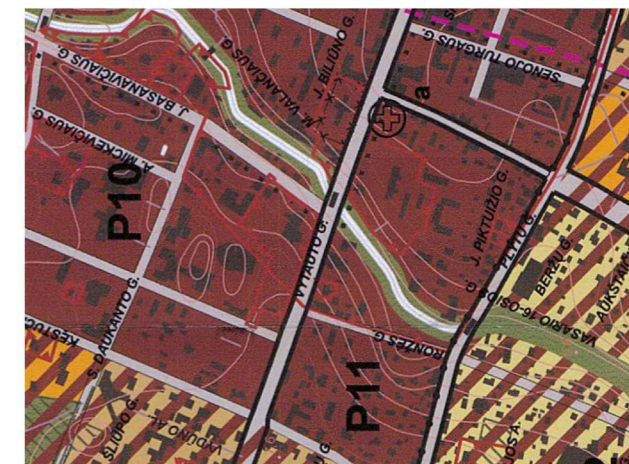
Ištrauka iš Palangos m. bendrojo plano Pagrindinio brėžinio