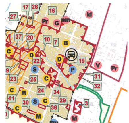
Ištrauka iš Palangos m. bendrojo plano Kultūros vertybės, švietimo, sveikatos ir kultūros infrastruktūros brėžinio

Servitutai: 206 - teisė tiesti požemines ir antžemines komunikacijas (tarnaujantis daiktas) - S1 207 - teisė aptarnauti požemines ir antžemines komunikacijas (tarnaujantis daiktas) - S1 208 - teisė naudoti požemines ir antžemines komunikacijas (tarnaujantis daiktas) - S1