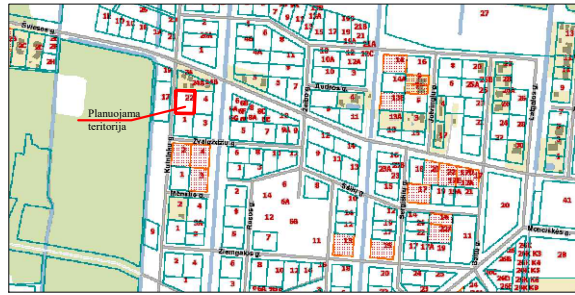
Planuojamos teritorijos situacijos schema