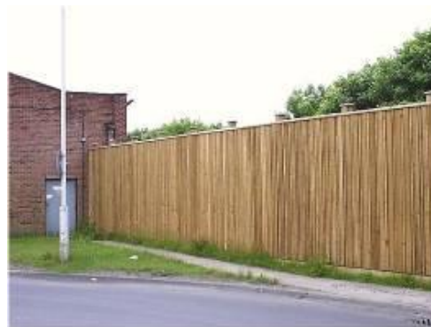
Medinių triukšmo užtvarų pavyzdžiai